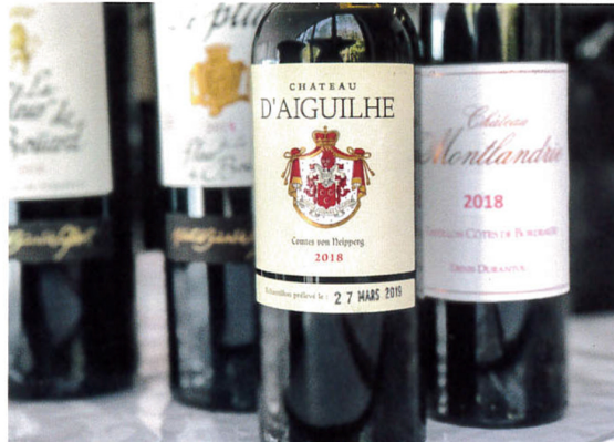
Ratings in red and all descriptions by Thomas Boxberger © 2019. Other ratings: Suckling = James Suckling | Parker = Robert Parker's Wine Advocate Translation of the wine descriptions: Thomas Boxberger and Leo Constantin von Schaabner

The grape variety ratio is of 80/20 Merlot to Cabernet Franc, with 14.5% alcohol, the wine is aged in 20% new barrels. Massive, dense style, with beautiful rich fullness and chocolaty reflections. Great freshness on the palate, very deep and racy, with excellent transparency of low pH from calcareous terroir, good length, and big pull. A hedonistic fun wine!